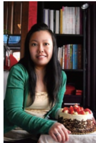
紫色透明 自由撰稿人