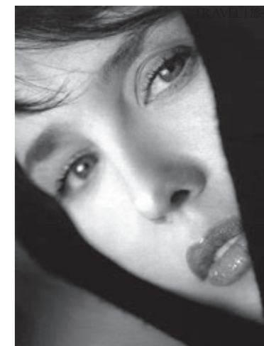
■伊莎贝尔·阿佳妮 (Isabelle Adjani)，法国影后。

优翔国际的健康产品是从全球范围、按照最高标准精心挑选：代表了健康领域全球公认的、领先的科技水平；无法复制，尊贵稀缺；经过长时间的历史传承和积累，无不良反应记录；由拥有核心技术和丰富经验的人（不仅仅是仪器）作为医疗服务保障；拥有享誉世界的口碑和众多成功的案例证明。尊贵的健康产品一定要匹配尊贵的旅行服务，因此，优翔国际所做的前期准备工作是最充裕的，亲自体验每一个行程中的每一家酒店、每一个餐厅、每一处景点、每一项服务，这就将私人健康旅行的服务限制在少量的客户人数，加之瑞士静港全球预约的体系，注定瑞士青春之旅只能成为少数中国贵宾可以拥有的私享之秘。