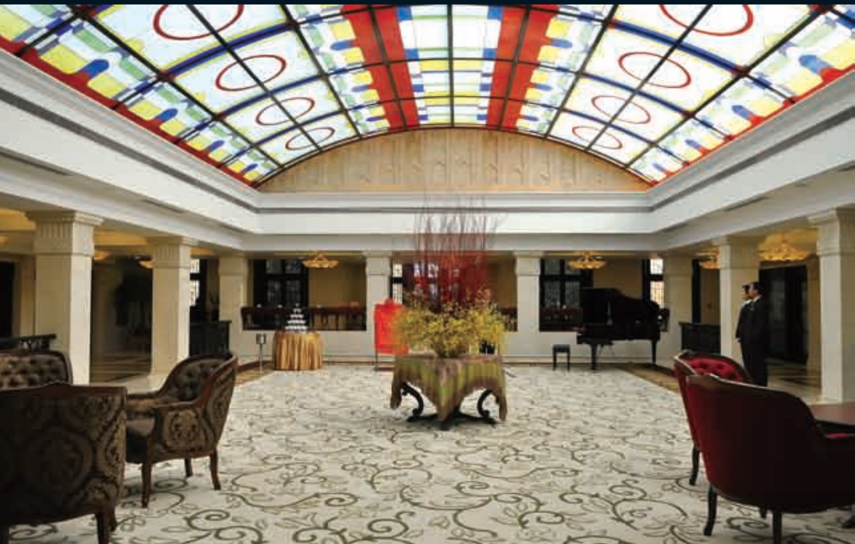
■多功能室(沙龙区): 聆听最新观念的财富课堂, 主办各色主题沙龙活动。