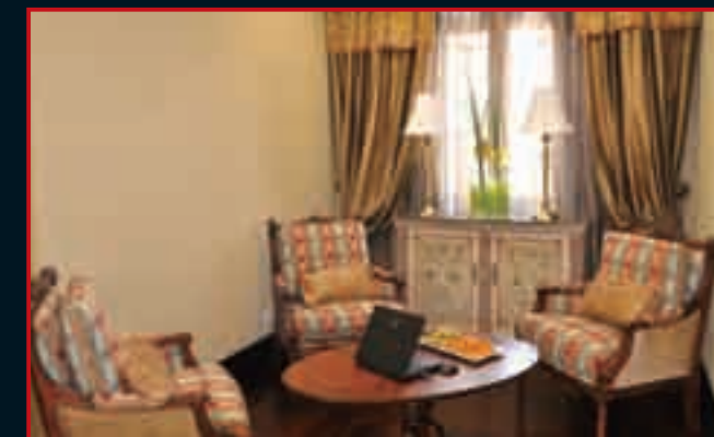
■洽谈室: 舒适的空间、轻松的氛围、温馨的环境, 令您心情愉悦。

中国工商银行浙江分行营业部羊坝头支行财富管理中心成立于2008年12月5日, 成立至今, 始终秉承这一服务理念——不设资产门槛, 只要有理财的愿望、健康的生活理念, 在交流中又能形成相互理解、相互信任的关系, 无论是什么行业, 处于什么年龄段, 都可以成为理财师的客户及朋友。“杭城首家不设槛的财富中心”的盛名不胫而走, 慕名而来者络绎不绝, 为支行积聚了人气的同时, 巨大的潜力市场也随之敞开。为了让客户了解各类信息, 为他们提供交流平台, 财富管理中心还定期为贵宾客户倾心打造专属的财富沙龙和PARTY, 目前, 已经成功举办了花鸟画展、圣诞PARTY、黄金讲座等几十场大型活动, 共吸引了客户几千人次参加。(定制方案详见P50—P55)