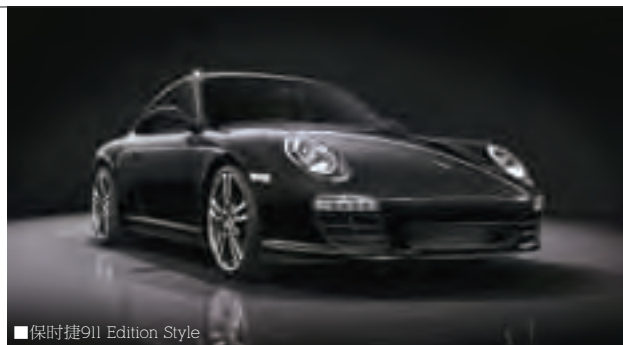
■保时捷911 Edition Style

用保时捷911 Edition Style与玛莎拉蒂GranCabrio做对比似乎显得不够厚道，但是也只有通过这种对比，我们才能更好地去感受GranCabrio的与众不同。排除价格因素，保时捷911 Edition Style不失为一款经典的跑车，单就性能而言，两者都已经达到了这个级别的极至乃至世界汽车技术的最高水平，而在细节处理和舒适性上，售价高出近百万的玛莎拉蒂GranCabrio显然做得更好。