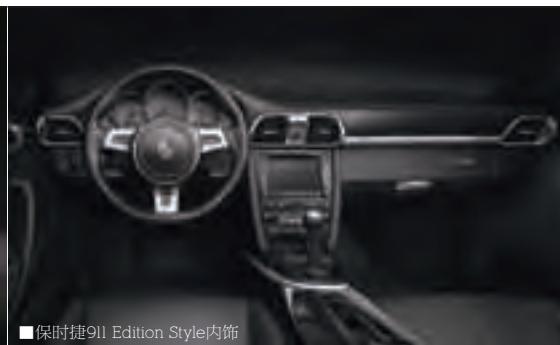
■保时捷911 Edition Style内饰