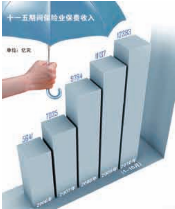
■“十一五”期间，保险业的保费收入和资产规模都比“十五”有了较大幅度的提升。五年内，中国保险业保费收入由2005年底的4928.4亿元增长到了2009年底的1.11万亿，2009年底总资产已经是2005年底的2.67倍。

保险包括疾病保险、医疗保险、失能收入保险和护理保险。健康保险可以提高个人和企业对健康保障的需求，对国家和社会能起到稳定器的作用。