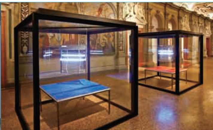
■ Prada基金会珍藏展：达明·赫斯特的《等待灵感》。