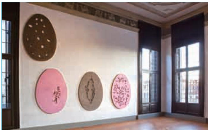
■ Prada基金会珍藏展：意大利艺术家卢西·奥芬塔纳的系列作品《概念空间》。