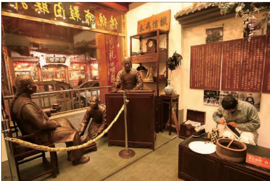
■ “中国布鞋第一家”内联升老店的大堂。