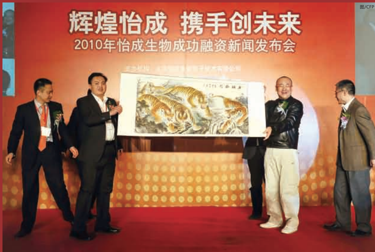
■图为2010年4月12日，红杉资本中国基金、优势资本宣布完成对北京怡成生物电子技术有限公司首轮7000万元人民币的股权投资。