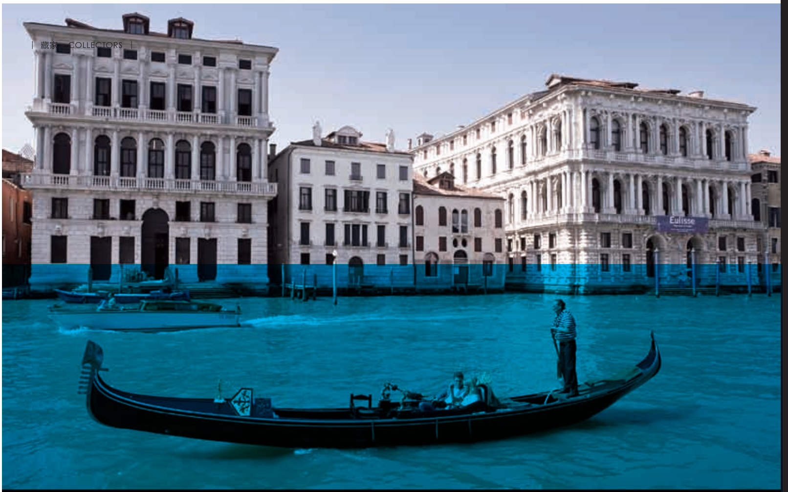
■ 威尼斯Ca' Corner della Regina宫殿远景。