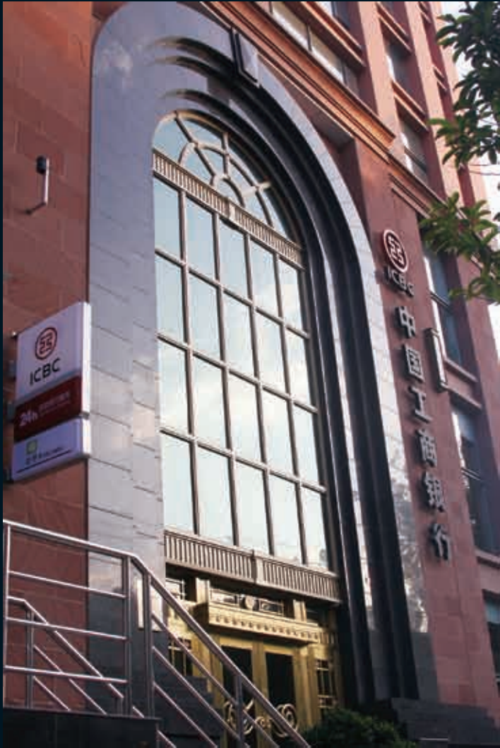
■财富中心大楼：有朋自远方来，不亦乐乎。