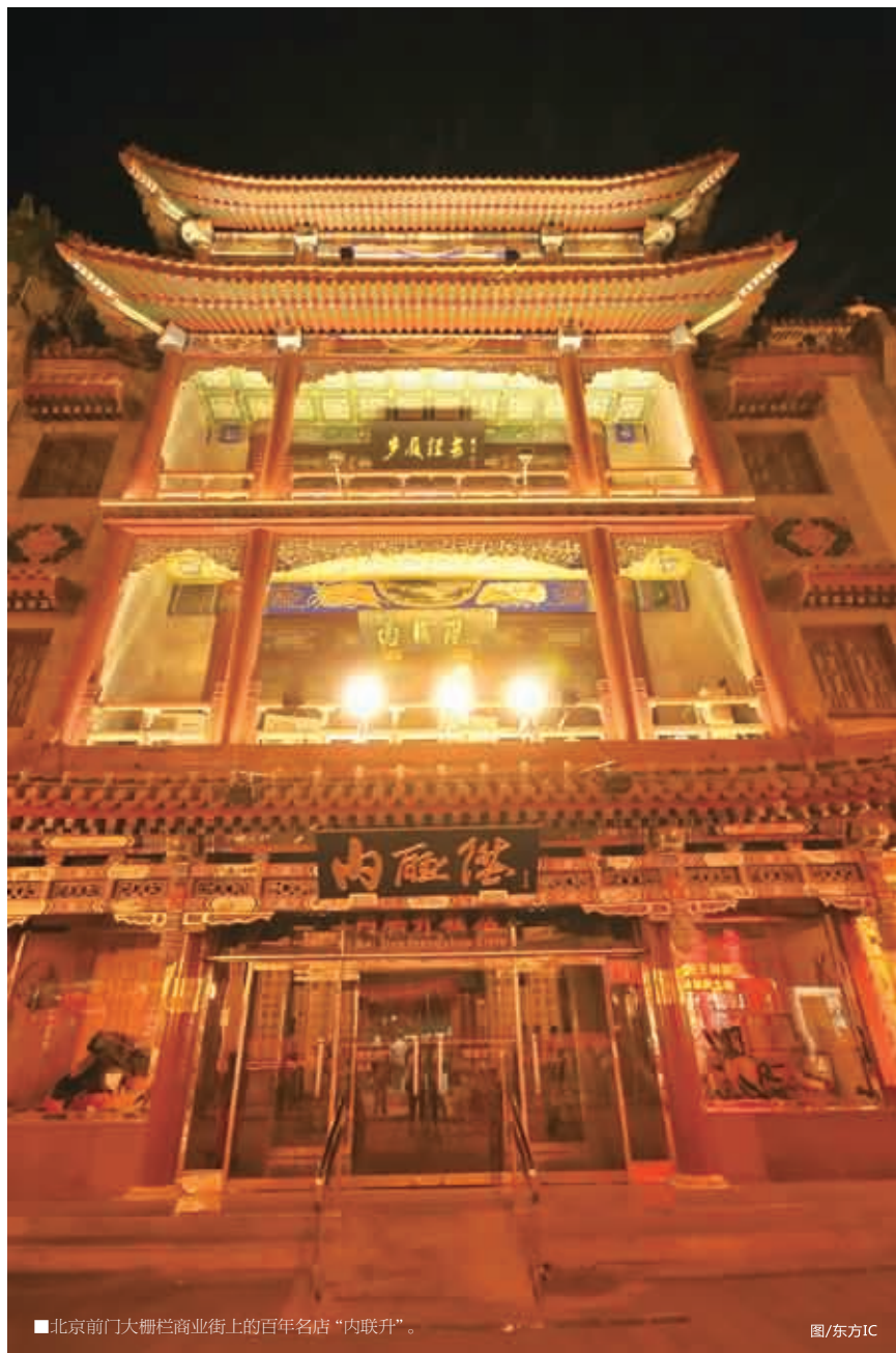
■北京前门大栅栏商业街上的百年名店“内联升”。