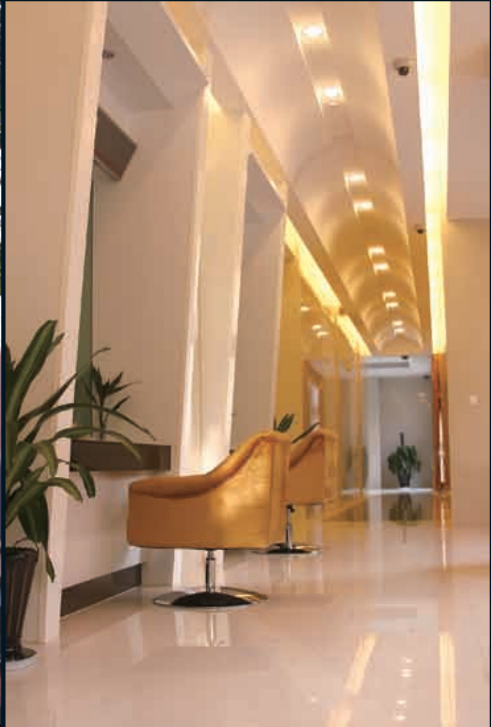
■现金/非现金区，尽享安全办理空间。

财富驿站：中国工商银行股份有限公司云南分行营业部翠湖财富管理中心 财富专线：0871—7395588 3395588