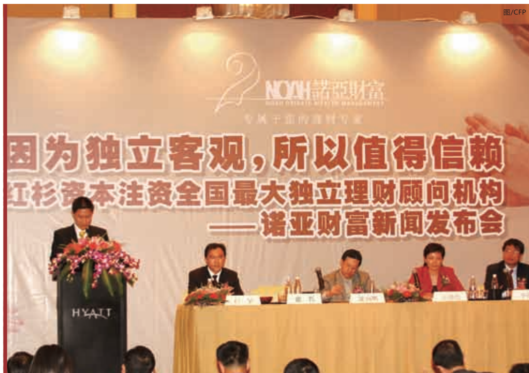
■图为红杉资本注资诺亚财富的新闻发布会现场。