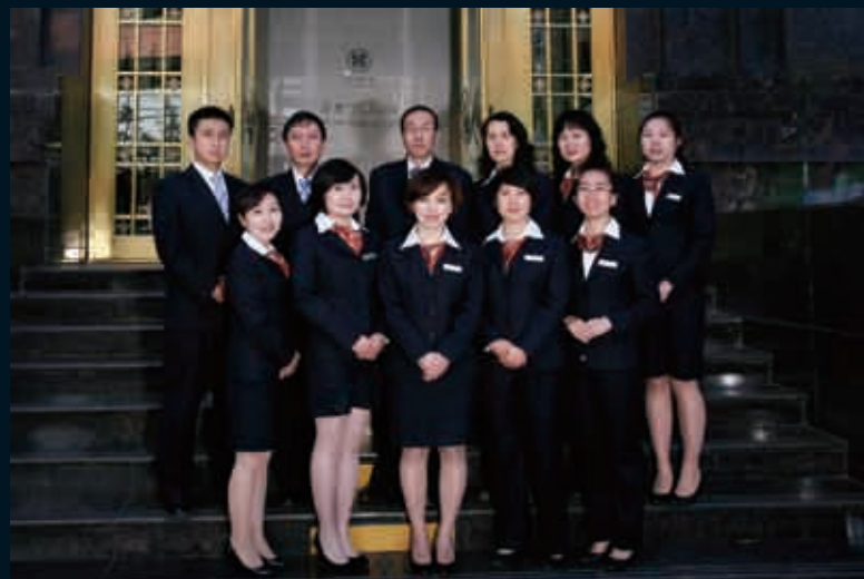
■ 理财师团队：专业的理财师为您的财富生活保驾护航。