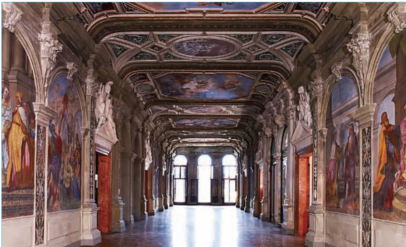
■ Ca' Corner della Regina宫殿的一楼大厅。