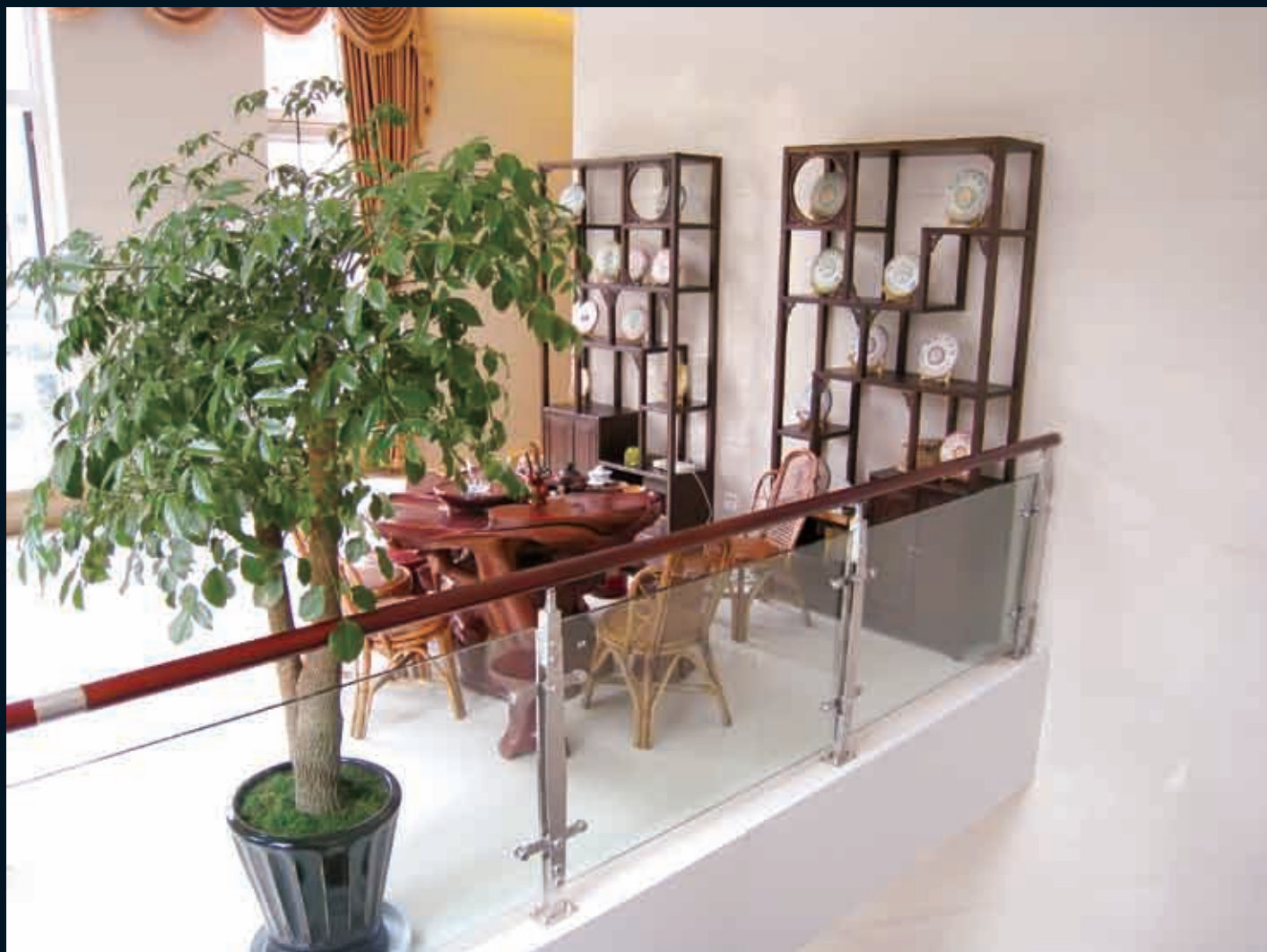
■ 普洱茶品鉴区：淡淡茶香透出财富管理中心浓浓的深情。