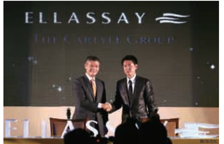
■2009年3月25日,凯雷投资集团与中国中高端时装品牌歌力思在北京宣布成立战略联盟。

追求卓越是凯雷投资集团矢志不移的目标。这种源于血脉的张力令凯雷奋进,也使凯雷得到业内诸多认可。无论身处怎样的市场环境中,凯雷始终为旗下公司和投资者把握良机。正如美国当代“喜剧皇后”贝特·米德勒(Bette Midler)所说的那样,一切都在青睐凯雷集团。