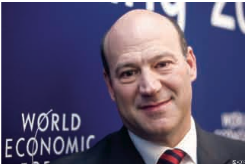
■高盛总裁盖瑞·柯恩参加第41届世界经济论坛年会。