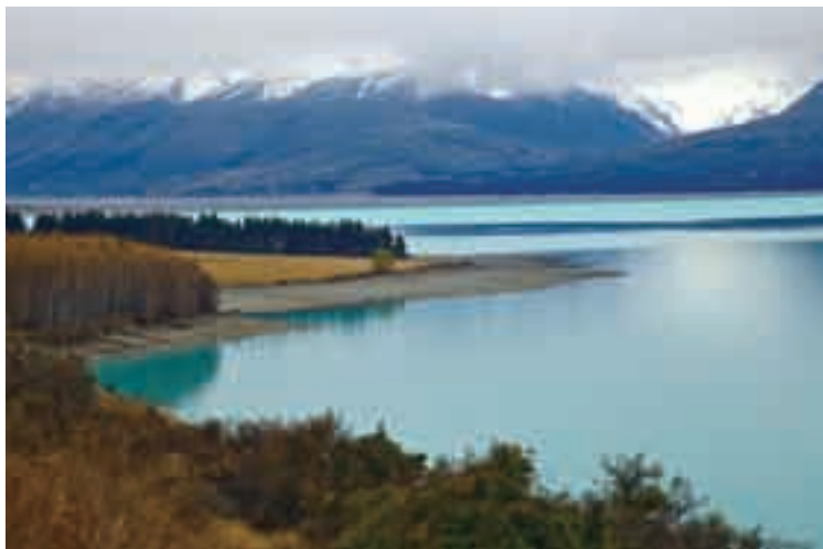
■库克山国家公园前的秀丽风景。