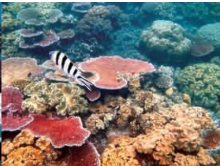
■鱼和珊瑚同舟共济。