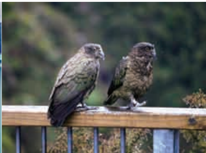
■库克山国家公园里的啄羊鸢鹫。