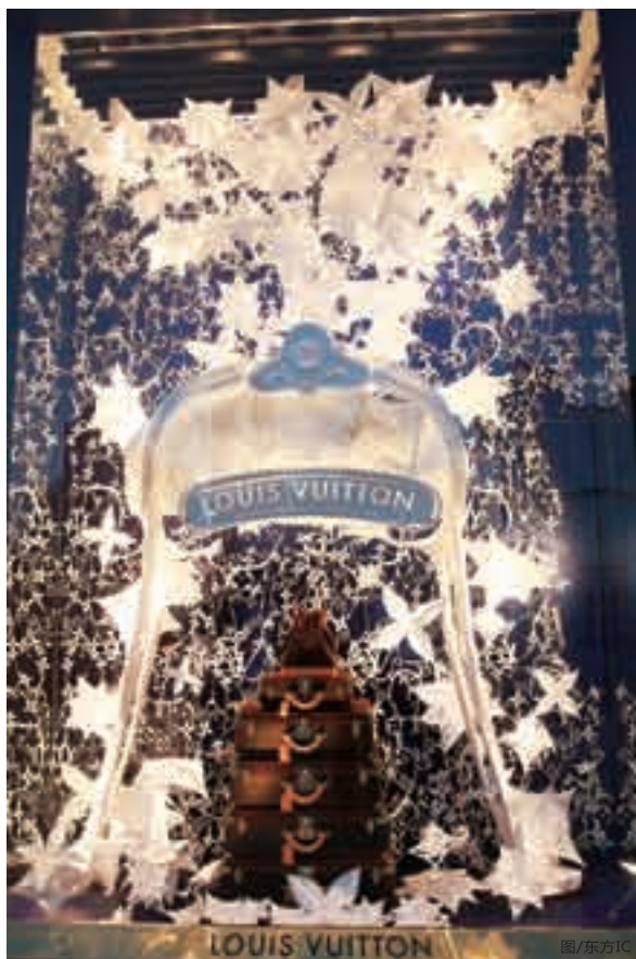
■图为上海陆家嘴LV店的巨大展示橱窗。

真正的大品牌，懂得把理念经营成一种“梦想”，作为激发其创造力的源泉，并借助其充满活力的品牌气息，使之成为一种源远流长的时尚，而这，正是奢华意义之所在。