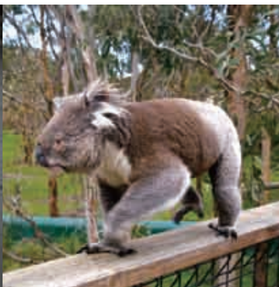
■菲利普岛半野生的考拉。