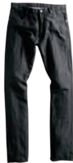
正装品牌的牛仔裤更精致稳重