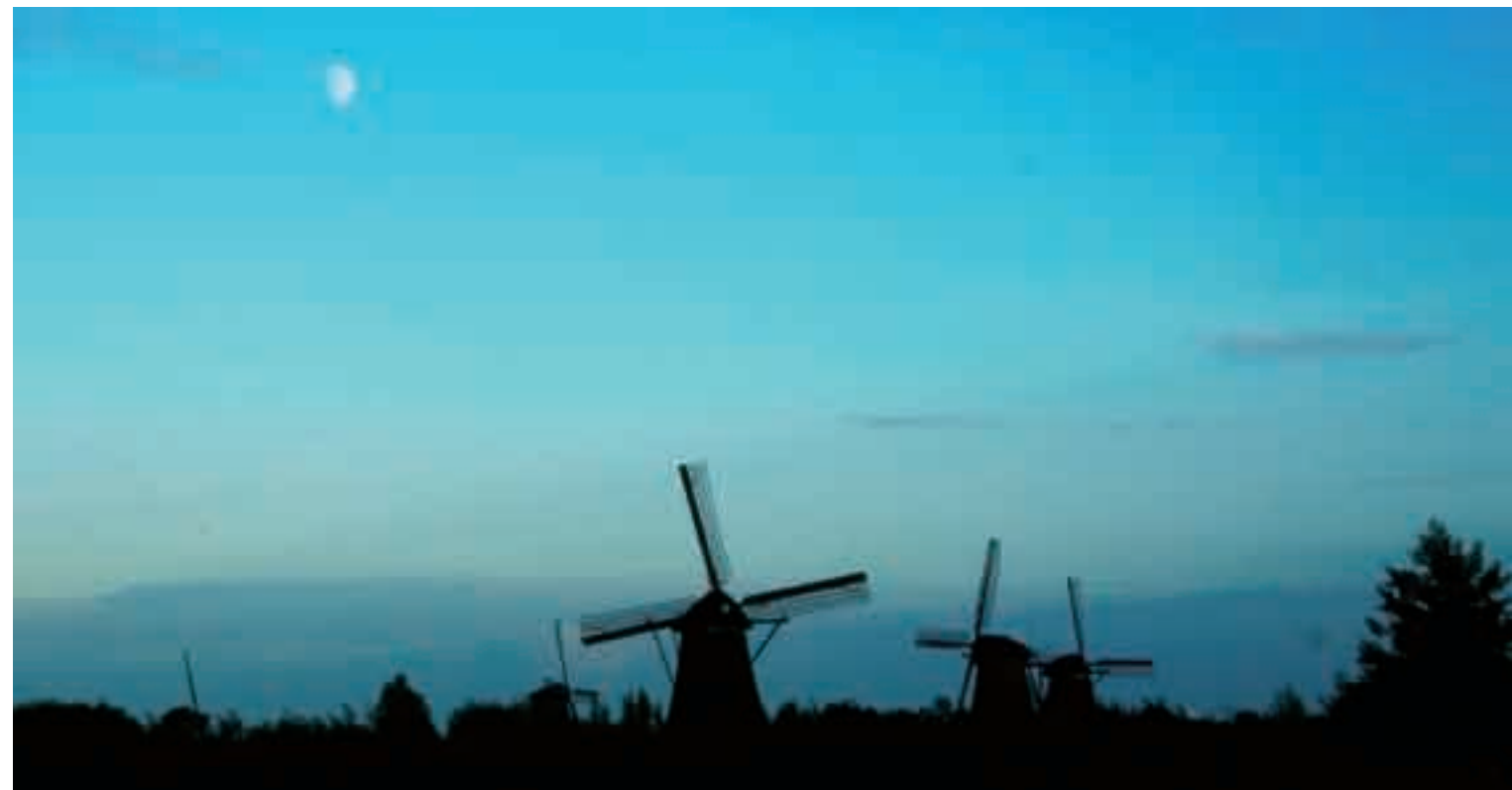
■时近黄昏的荷兰鹿特丹风车村。

注意事项： (1)任何公共场所禁止吸烟。(2)除了餐厅，一般公厕都要收费的，包括博物馆、快餐店内的厕所，一次0.5欧元—1.0欧元。(3)如果你在荷兰买了比较贵的物品，可以享受退税。一天内在