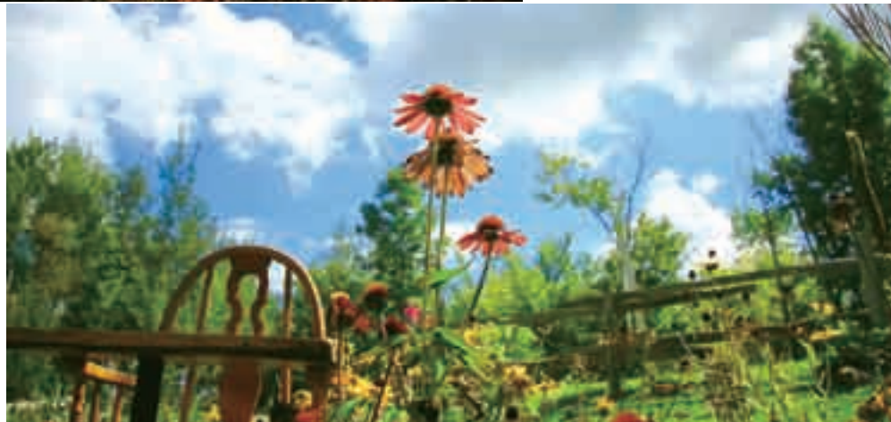
■加拿大秋季田园风光。

看点： 尖顶的教堂远远地成为画中的焦点，清澈的小河纵横交错，一排排一座座五彩相间的民居散落在河道两旁，遍野的大树、盛开的鲜花与河中的芦苇相映成趣，而散养的花奶牛和肥壮的羊儿则在田野里悠闲地觅食……邂逅这乡村的诗画，真让人不想离去。