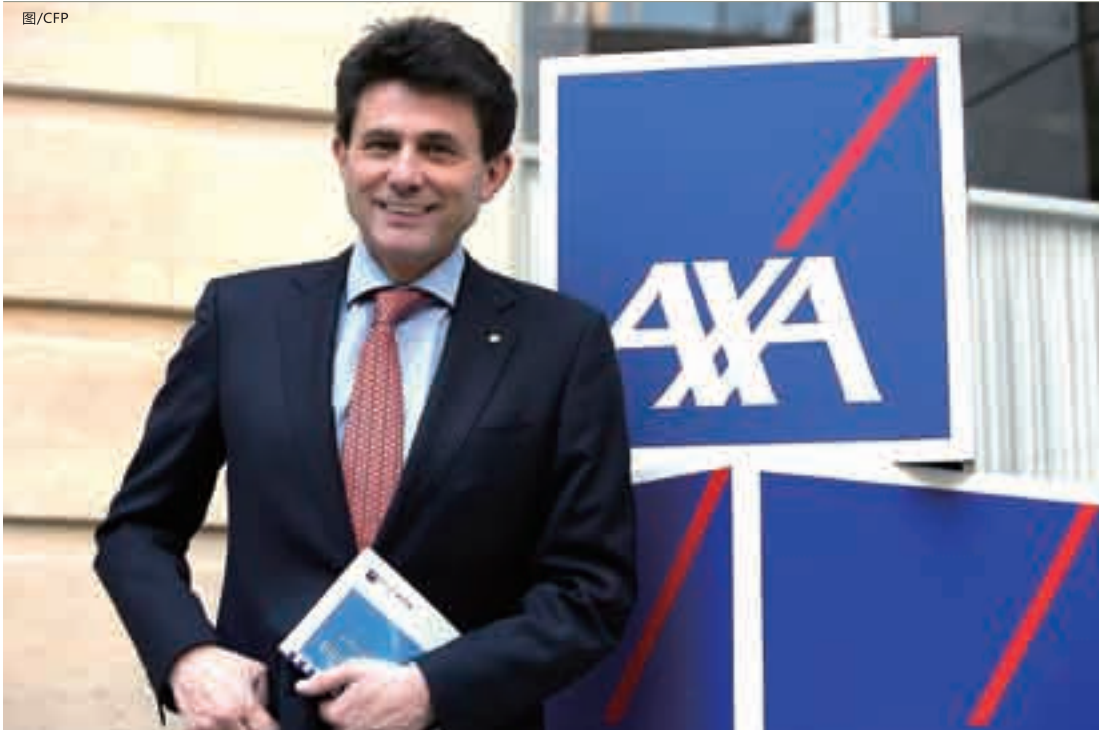
■图为2009年2月19日，法国安盛CEO亨利·德·卡斯特利（Henri de Castries）准备在巴黎公司总部公布当年业绩报告。