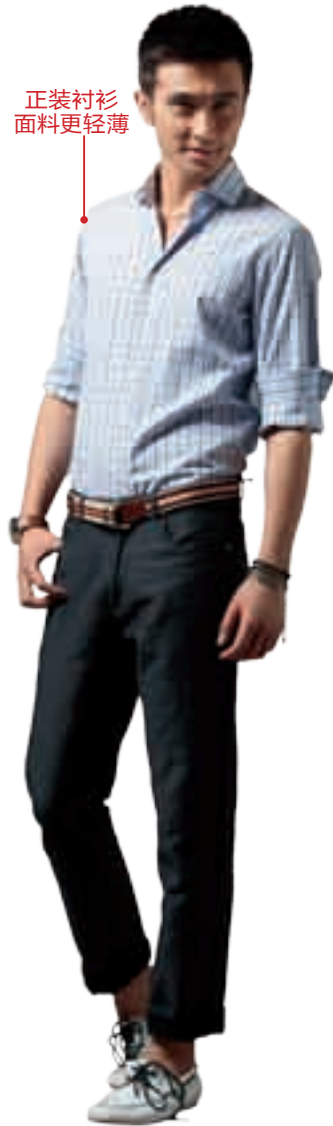
正装衬衫面料更轻薄