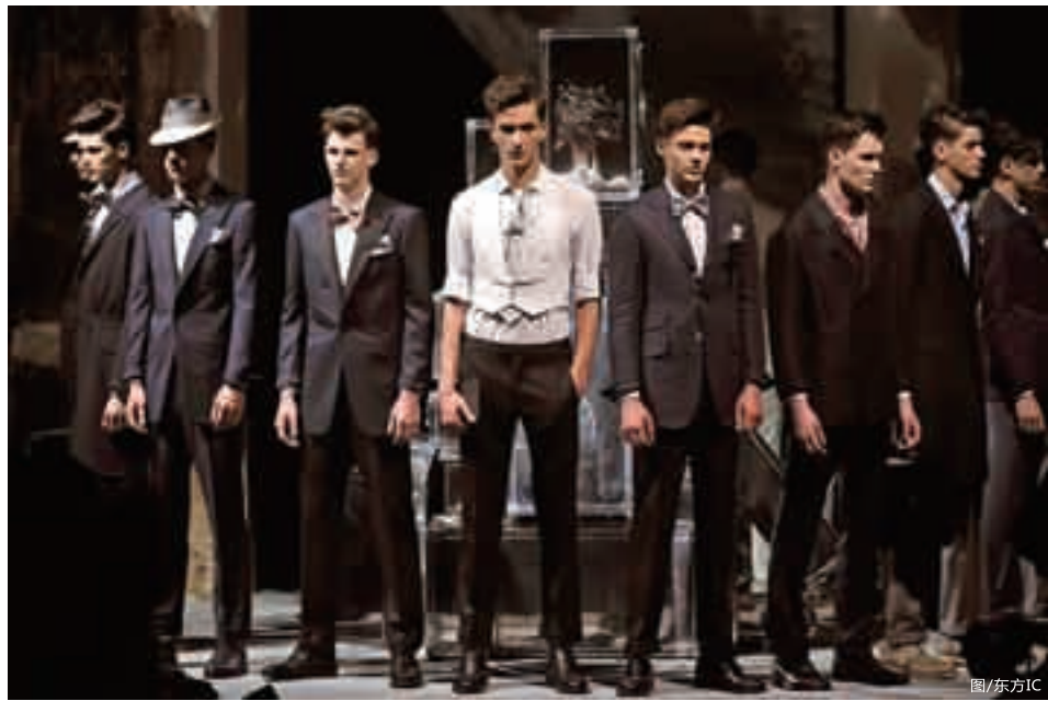
■登喜路2011时装发布会。