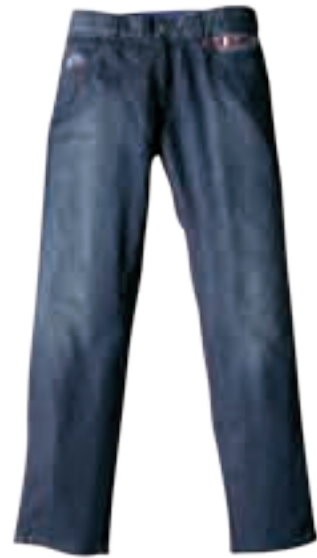
海洋气息从徽章中扑面而来