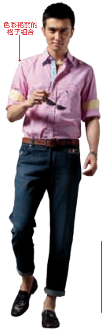
色彩艳丽的格子组合

经过水磨处理的牛仔裤现在比较热门，所以，几乎每个人都穿着一条洗得斑驳的牛仔裤，没怎么经过水洗的牛仔裤，几乎就应成为大叔款的代名词。其实，一条合身的牛仔裤在某种程度上可以替代休闲裤，甚至可以替代正装裤，关键在于要有一个利落帅气的造型。