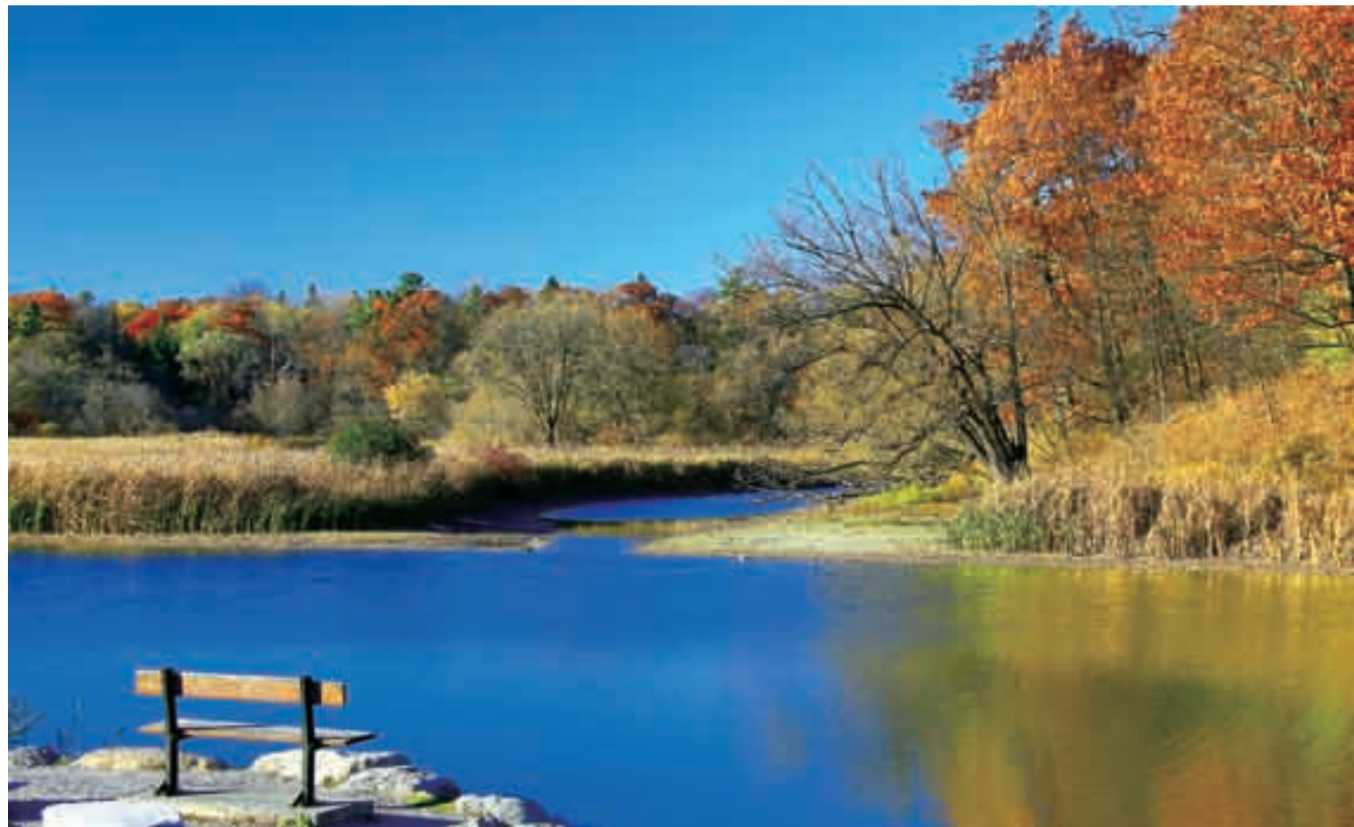
■加拿大多伦多美丽的郊野湖泊。