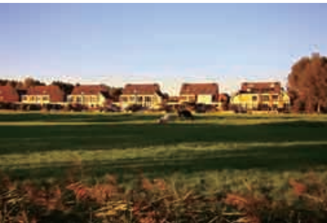
■荷兰开阔而静谧的乡间田野。