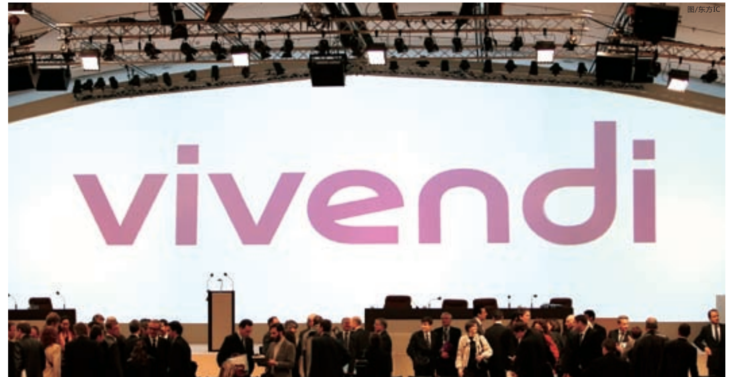
■ 图为2006年4月，KKR出资近510美元收购法国音乐和电信业集团威旺迪（Vivendi）。

虽然KKR的辉煌记录数不胜数，但让KKR集团真正变得大名鼎鼎的当属美国历史上最大的杠杆收购——对食品和烟草大王雷诺兹·纳贝斯克（RJR Nabisco）的收购（在剔除通货膨胀因素之后，收购额至今排名第一）。1989年2月9日，KKR以250亿美元的天价完成了对雷诺兹的收购，超过200名律师和银行家与会签署了收购合同。在整个收购案中，KKR付出的代价极小。由于该公司之前发行了大量垃圾债券进行融资，并承诺在未来用出售被收购公司资产的办法来偿还债务，因此，这次收购资金的规模虽然超过250亿美元，但其中KKR使用的现金还不到20亿美元。这起被称为“世纪大收购”的杠杆收购，令盛极一时的RJR Nabisco元气大伤，至今仍难以复原。