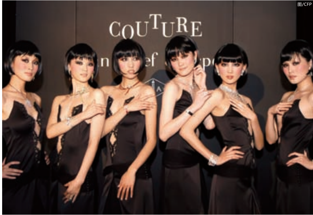
■ 梵克雅宝在北京推出的Couture顶级珠宝系列发布会。