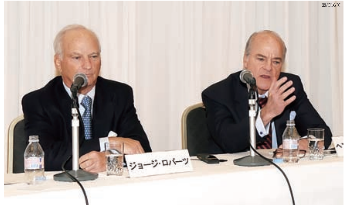
■图为KKR集团创始人乔治·罗伯茨(左)和亨利·克拉维斯(右)。

KKR参与的企业完成杠杆收购后,股权结构通常分为三部分:一般合伙人,通常由KKR充当,负责发起LBO+MBO交易,作为LBO+MBO企业经营业绩的监管人;有限合伙人,负责提供LBO+MBO所需要的股权资本并主持薪酬委员会;LBO+MBO企业高层人员,持有一定比例的公司股份。当然,“交易”并不仅仅是融资交易本身,更是管理层、债权人和收购者间就公司在今后5年—7年试图实现目标的一系列计划和协议,这些规划以偿付时间和债务条款的形式包含于融资结构中,使债务约束、股权和高绩效标准三者环环相扣。