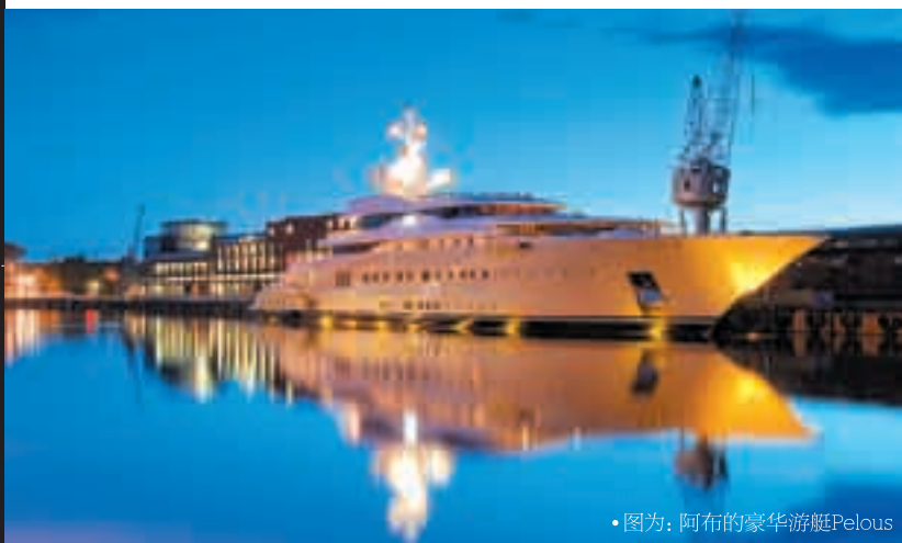
• 图为: 阿布的豪华游艇Pelous

投资收购切尔西的那笔钱对阿布来说根本就是九牛一毛,他为切尔西足球队夺取联赛冠军的悬赏奖金,更是达到了创纪录的每人120万欧元。英国媒体曾经把阿布的财产形象化:足够自己举办一次奥运会,然后用剩下的钱再把温布利大球场翻新9次。阿布仅仅靠石油一项,年进账就能达到90亿欧元,他所到之处永远是私人飞机、金发美女和没有上限的信用卡。当然,切尔西足球队才是阿布的最爱。