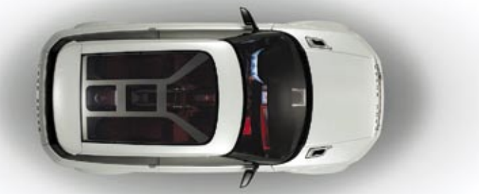
全景透明玻璃车顶，保证了敞亮的内部环境