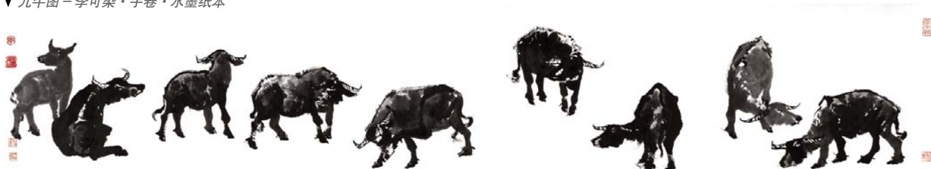
▼ 九牛图 - 李可染 · 手卷 · 水墨纸本