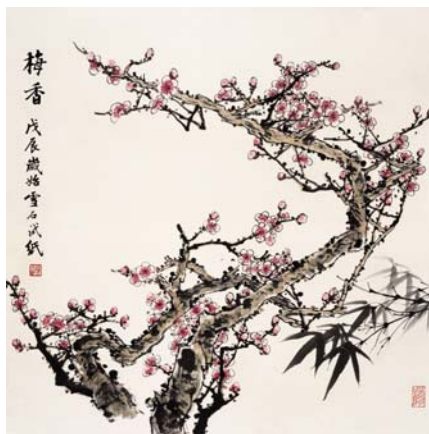
► 梅花—白雪石·立轴·设色纸本

从表面上看，有贵族收藏和民间收藏，任何收藏品都要经过历史的淘洗，并为人民大众认可和接受，才能成为有价值的藏品。收藏源于民间，它的最高使命是服务大众，并汇入文化的主流。收藏的领域在各历史阶段不断变换，有时扩展的很广泛，但不一定都能流传下去，这里有一定的局限性。目前，有些“藏品”能流行一时，是因为在市场上还能换点钱，有些东西不能代表历史主流，又没有科学价值和艺术品位，也就没有了收藏价值。