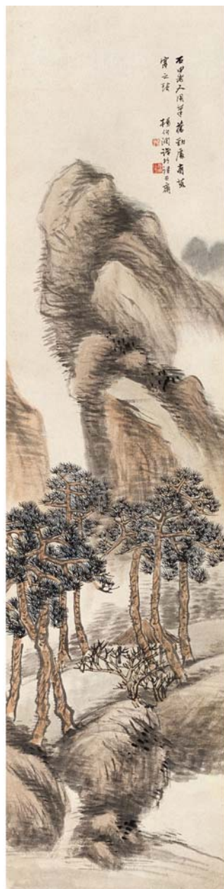
山水四屏—杨伯润·立轴·设色纸本