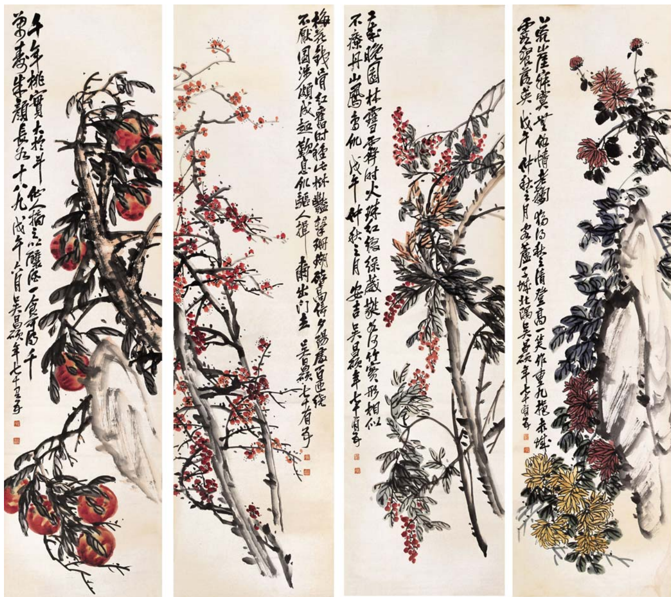
▲ 花卉四屏—吴昌硕·设色纸本