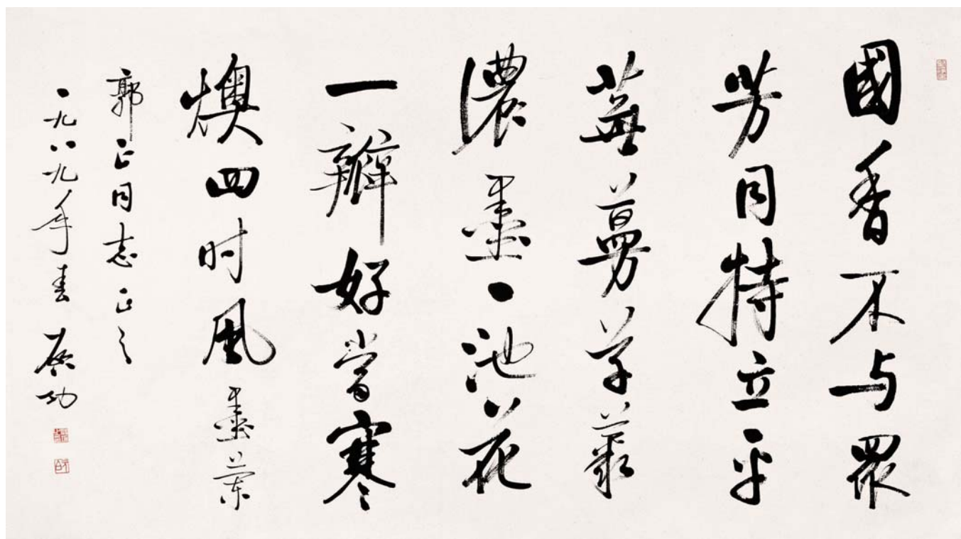
▲ 书法—启功·水墨纸本

图注：收藏不是简单的收集和保藏，许多收藏品具有丰富的审美和艺术鉴赏内容，它自始至终或多或少自觉不自觉地贯穿着收藏过程。