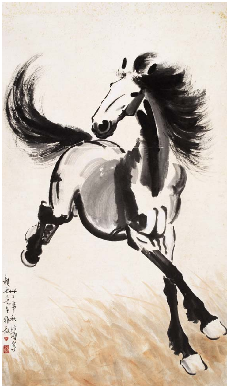
▲ 马 - 徐悲鸿 · 水墨纸本