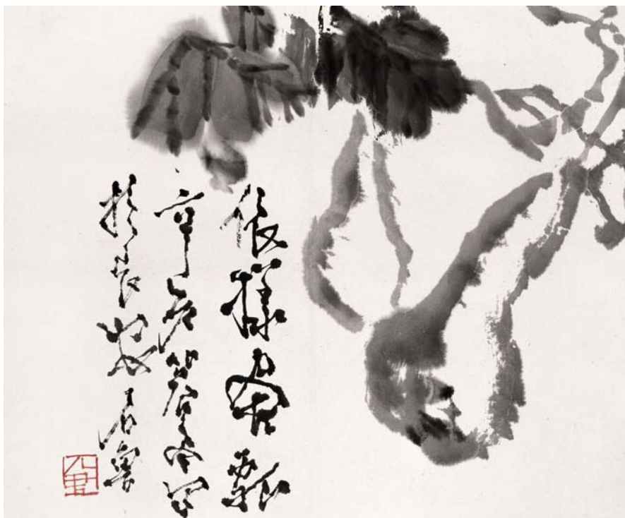
▲ 依样画瓢 - 石鲁 · 立轴 · 水墨纸本