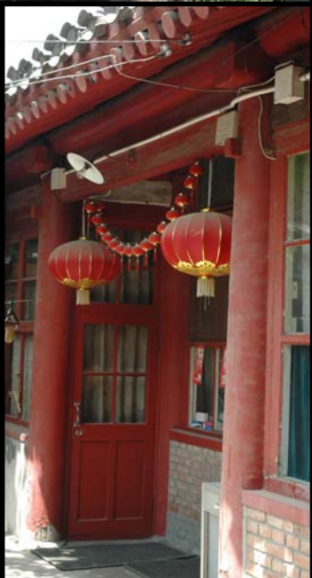
► 明末大将洪承畴宅北房三间