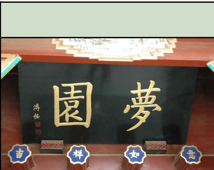
▲ 秦老胡同 35 号院东院是“梦园”，末代皇帝溥仪弟弟爱新觉罗·溥任所提“梦园”二字