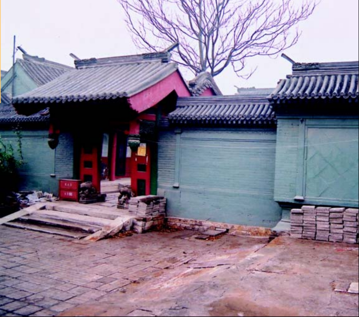
◀ 帽儿胡同9号内垂花门及照壁