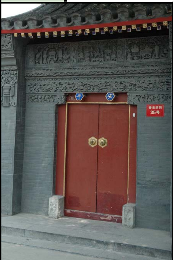
▲ 秦老胡同 35 号 院大门

位于秦老胡同 35 号，原为晚清内务府总管大臣索家宅子的花园部分。索家原在秦老胡同中部有一所房子，后屡添建，渐渐从中部扩展到秦老胡同西口路北的索宅全部归索家所有。索氏后代是曾崇。因曾崇的儿媳为清末代皇后婉容之姨，故民间流传这所房子是“皇后的姥姥家”的说法。35 号院原来是索家的花园，名曰“绮园”，至今院内的假山上仍有“绮园”二字的刻石。“绮园”除了了有亭、水池、楼阁等建筑外，最有特点的是园中有一个仿江南园林中建筑——船型敞轩，这敞轩底部好似一艘大船，船体上为仿木建筑敞轩，造型独特。后来曾家将房屋分割出售。买主将花园内建筑全部拆除，重盖房屋，只保留大门内靠东的一组假山。所以我们现在看到的花园显的十分宽敞，不像一般四合院那样紧凑。