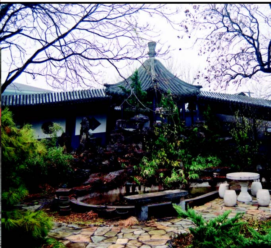
◀ 后圆恩寺7号东院的 爬山廊