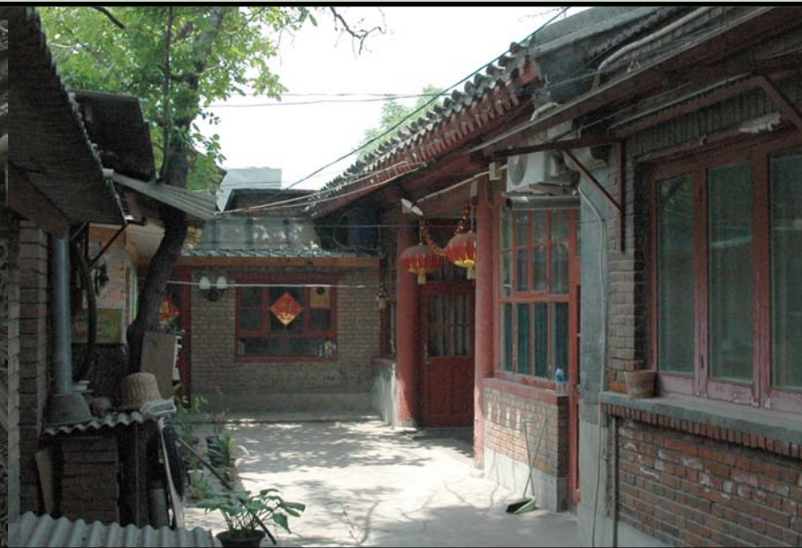
▲“拱门砖雕”雕刻的“福在眼前”