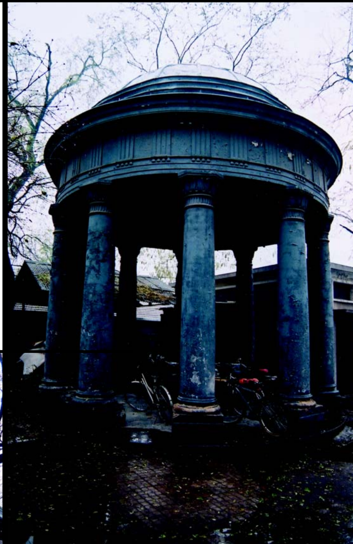
▲ 后圆恩寺7号院内花岗岩的 西式圆亭

位于后圆恩寺7号，此院子是一座既有中式四合院又有西洋式建筑的宅院，它的中部是一西洋式楼房，楼前有一个喷水池，周遍还点缀的从圆明园移来的石刻，池子的东南有一个花岗岩的西式圆亭，由棱柱支撑者。此园子是清代铁帽子王之一的庆亲王奕劻的第二个儿子载搏的。据说，载搏诸兄弟中最会享乐的一个。当时载搏娶了一个叫宝宝的名妓，为了博得她的欢心，便按其意建造这个中西合璧的宅院。此宅院后来一直做为国民党政府总统蒋介石的行辕。解放后，此地为中国共产党华北局所在地。现此宅院为友好宾馆，为北京市重点文物保护单位。 [1]