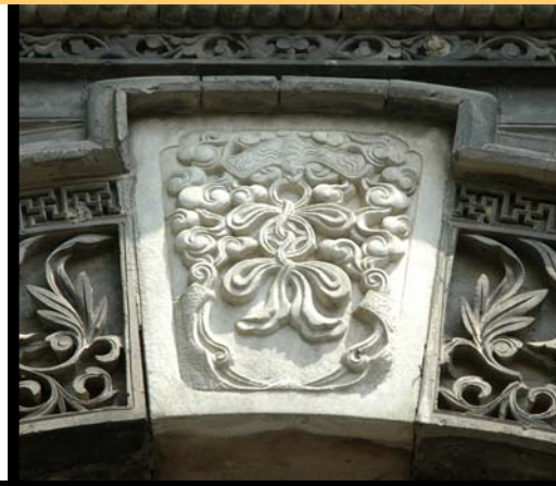
▲“拱门砖雕”雕刻的“福在眼前”

位于东棉花胡同15号院内，这是一座三进的四合院，原来的大门已经拆除，院内的垂花门也已改建成一间房子，二门就是拱门砖雕。门为拱圆形，高4米多，宽2.5米左右。从金刚墙以上均为砖雕，上刻有花卉走兽，顶部有朝天杆，栏板上雕刻着梅花、兰花、竹等图案，如此精美的拱门砖雕在北京不多见。该宅院原来的主人是清末吉林将军凤林山。此人与慈禧交情甚厚，以前东棉花胡同一半的地产都属于他。此院子现为民居。拱门砖雕现为北京市重点文物保护单位。