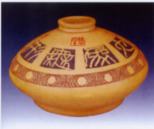
手工紫砂罐·双刀篆书·大象无形 高33cm x 直径58cm