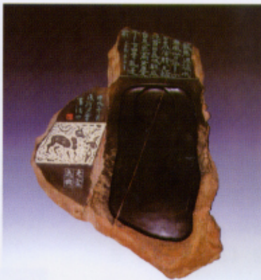
双刀隶书·王昌龄诗“塞下曲”