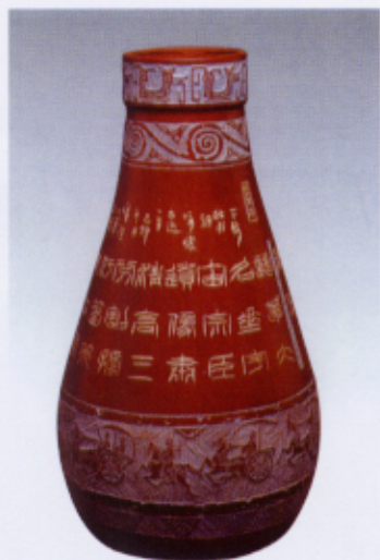
注紫紫砂瓶·单刀篆书·杜甫诗“咏怀古迹”之一 高54cm x 直径30cm