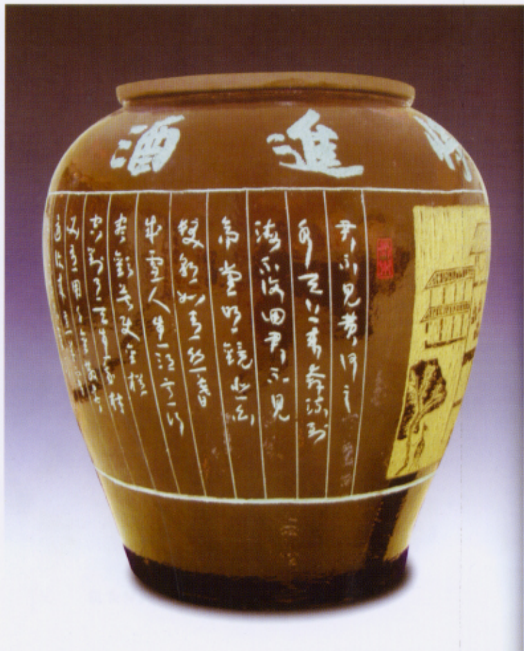
陶酒坛·单刀草书·李白诗“将进酒”·拟汉化宴酒图 高108cm x 105cm

集了一些有图案的汉砖，以之对照，几可乱真。例如他刻的山峦，完全是汉画像石里的刻法，在敦煌壁画里也可见到。直到展子虔的《游春图》，顾恺之的《洛神图》，山头的画法还是如此。而他刻的人物，也宛然如汉画像石上的风貌，例如他的《酿酒图》、《苏武庙诗图》，还有那幅乐舞图，让你一看就感受到汉刻的风味。