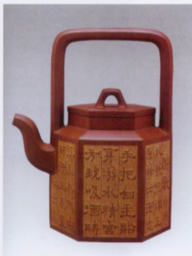
双刀阳文隶书·陆游诗“醉歌”

复澄摹刻的那片小屯甲骨，真是摹写逼真，最难的是他是用刀，完全是甲骨刻辞的刀法，而不是刻紫砂的刀法，虽然同是“刀笔”，却