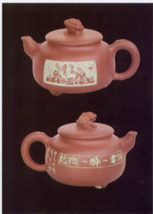
冲刀楷书·与君一醉一陶然，拟汉化对饮图

复澄的刻印，也别有风味，完全是运用他古文字学的学问和刻陶艺术的融合，横放杰出，不可羁勒。曾为我刻过一方“横绝太空”的阳文闲章，真有“横绝太空”之势。