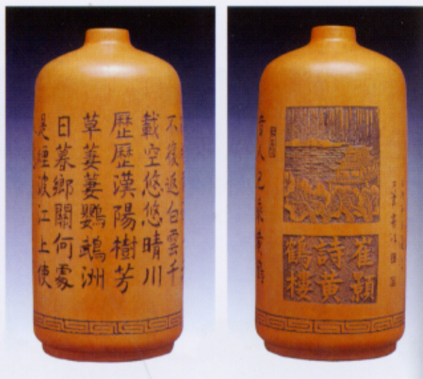
手工紫砂瓶，单刀楷书，崔颢诗“黄鹤楼” 刀笔题画，双刀阳文诗题 高41cm × 直径22cm